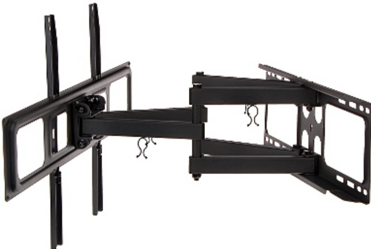
Widok od strony mocowania do ściany: